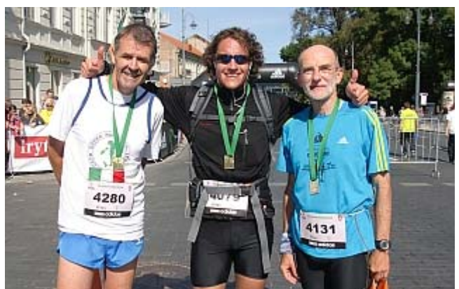
Ein Hamburger, ein Schlesier und ein Südtiroler haben es geschafft! Trotz 11. September, trotz Wirtschaftskrisen, trotz Doppelbelastung, trotz...