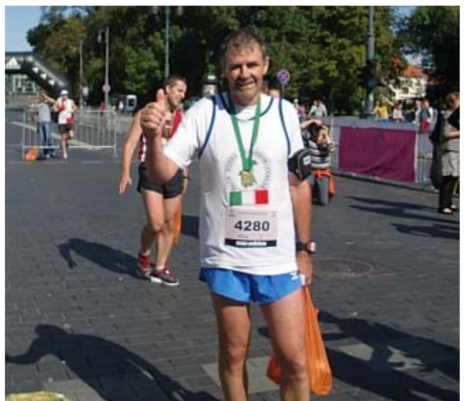
Marathon Nr. 179 ist gelaufen, mit SB noch dazu!