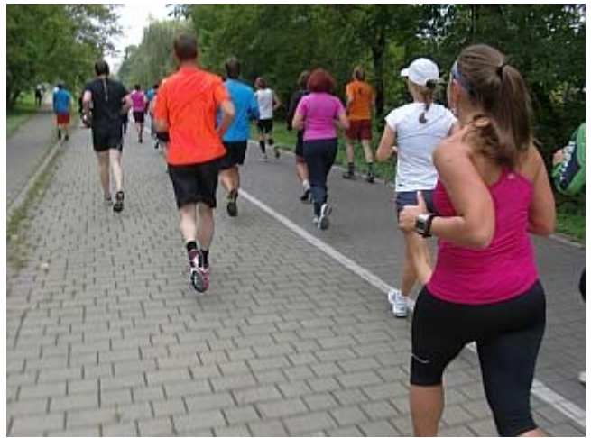
Oder heute doch wieder mittendrin mit dem Drang nach vorne

Beim gemeinsamen Abendessen tauschen wir noch Lauferfahrungen aus und schmieden Pläne. Aufgepasst, solange ich den Hammer zum Schmieden in der Hand habe, ist die Wahrscheinlichkeit groß, dass trotz Marathonweltwirtschaftskrise irgendwo etwas stattfindet, ansonsten gibt es halt öfters Überraschungen.