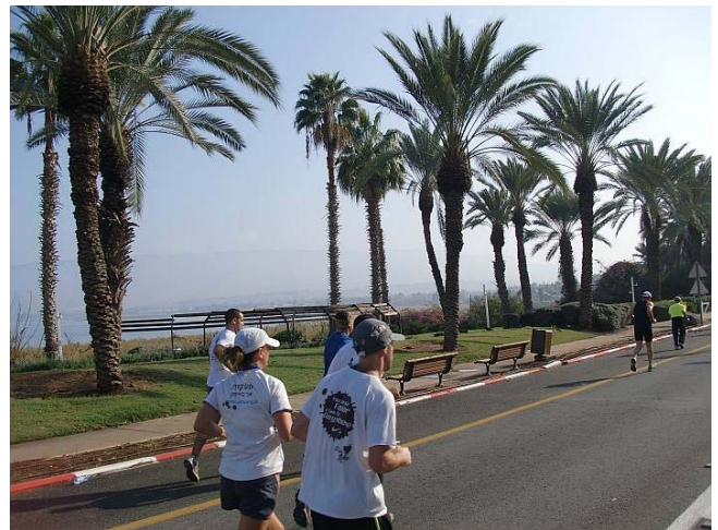
Daran könnte man sich im Winter gewöhnen