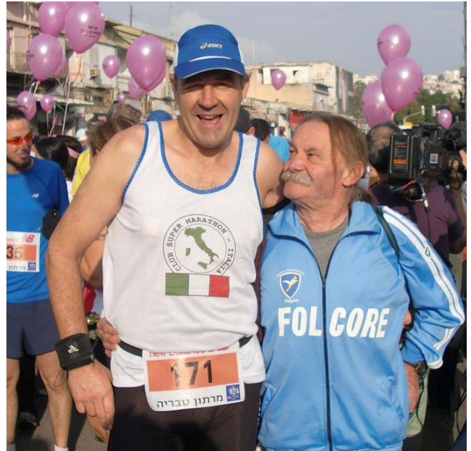
Habe ich heute einen Personal-Trainer!?

Wenn mich also jetzt jemand fragt: „Was denkst du über Israel?“, antworte ich: „Gehe selbst hin und mache deine Augen und Ohren auf!“