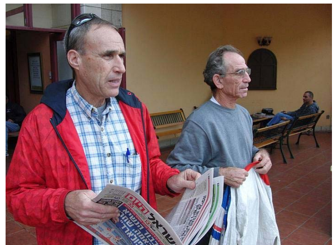
Morgen wird es schön, steht in der Zeitung!??