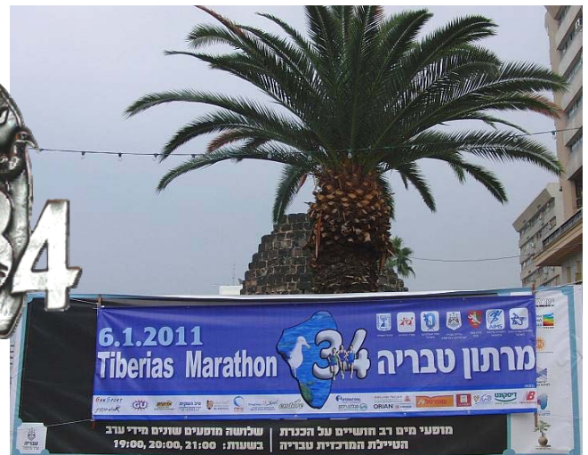
Der Marathon findet immer an einem Donnerstag statt