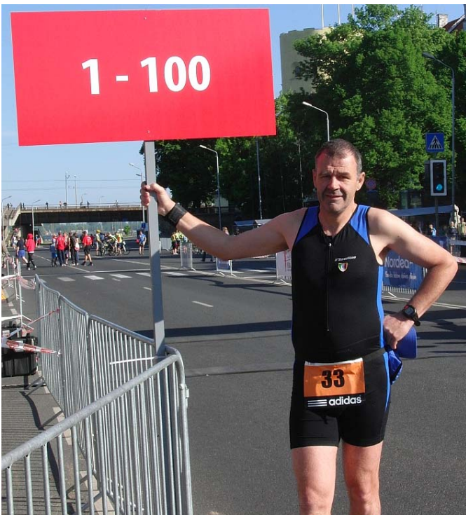
heute wieder Start in der ersten Reihe

Wie schon ein alter Werbespruch sagt: „Für diese Medaille rennen wir meilenweit!“ Und die Sohlen unserer Laufschuhe lassen hier auf diesem besonderen Laufuntergrund besonders viel Gummi.