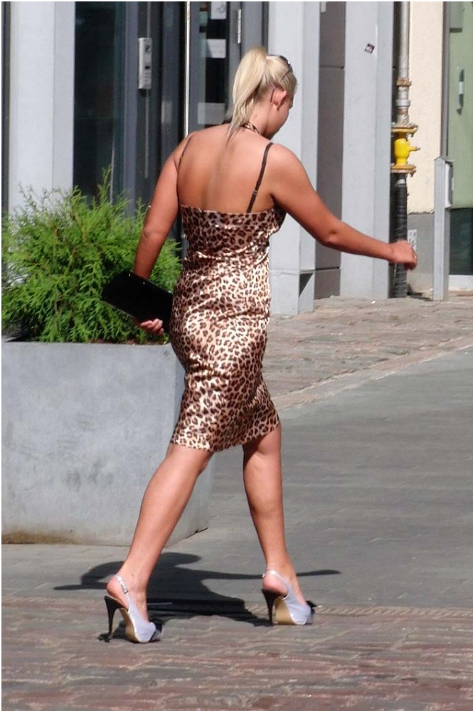
die Kunst, in der Senkrechte zu bleiben, und Grund für manche Seitenblicke

Jedenfalls sicher in dem Moment, wo du dich einfach einmal im wahrsten Sinne des Wortes hinlegst, wenn ein ganz unauffälliger „Liegender Polizist“ aus Steinen der ganz gemeinen Art plötzlich zum unüberwindlichen Hindernis wird.