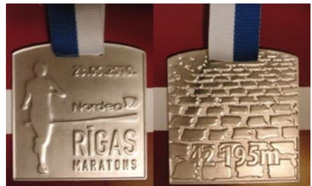
selbst die Medaille trägt dem Ganzen Rechnung

In diesem Sinne, bis zum nächsten Laufabenteuer!