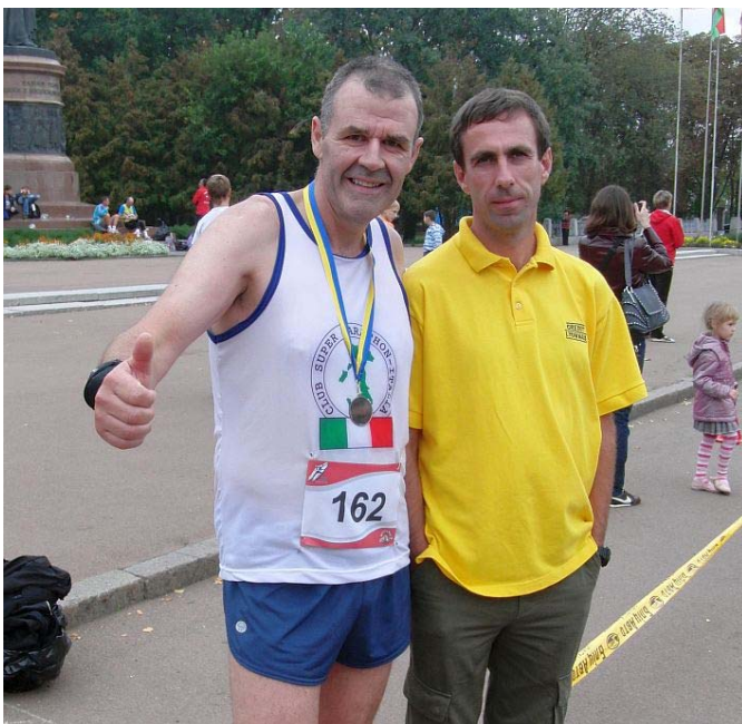
Unser Chauffeur, auch mit eingespannt im Team