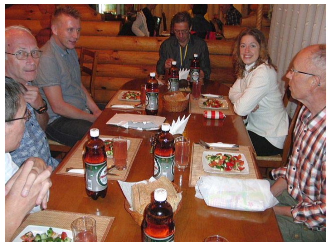
... und beim Marathondinner sangen sie sogar ein schwedisches Lied; ein Beweis mehr, dass auch sie sich in der Ukraine wohl fühlten