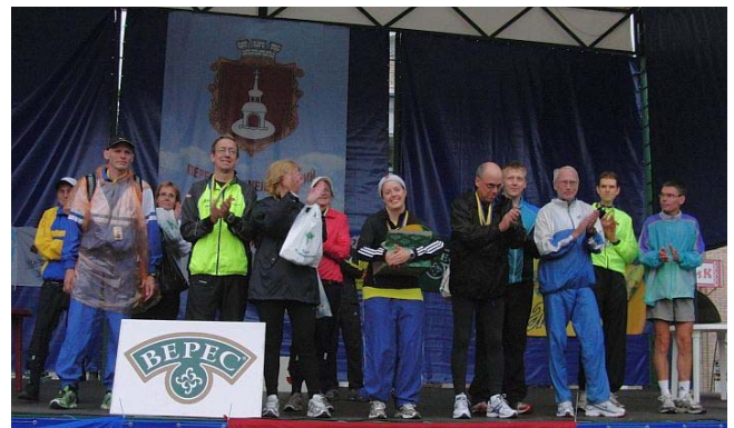
...und applaudierten nach dem Lauf dem Veranstalter