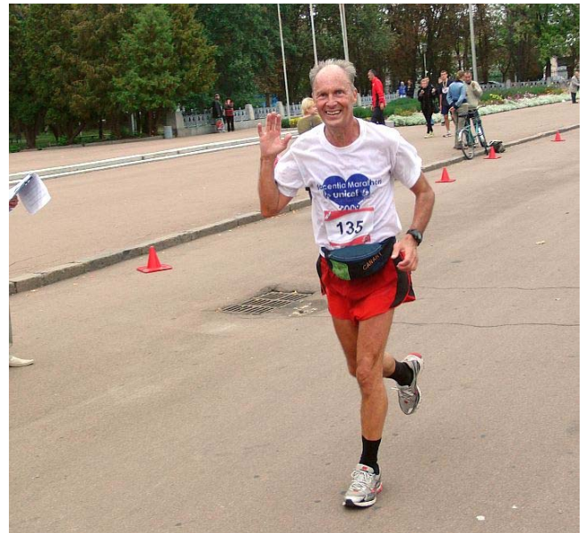
die Schweden hatten sichtlich Spaß beim Laufen ...