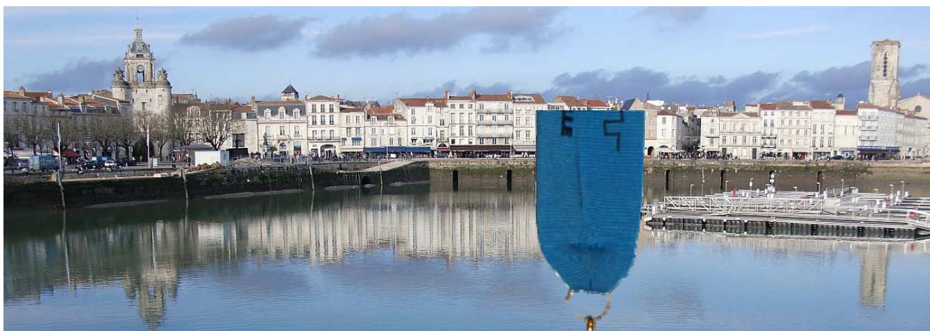
Der alte Hafen bei Ebbe

Marathon de La Rochelle, mir klingt das auch nach vier Jahren noch in den Ohren, dieses rollende R der alten Damen am Stand bei der Marathonmesse in Florenz 2006.