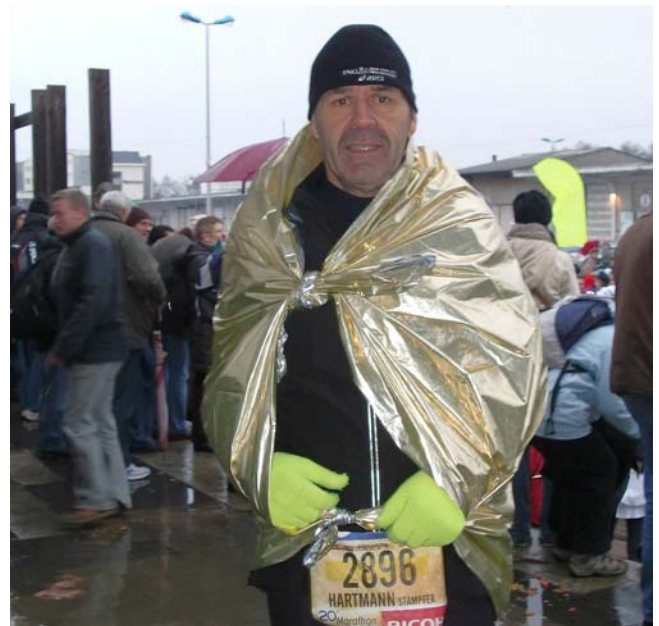
Das ist nicht etwa im Ziel, nein, vor dem Start