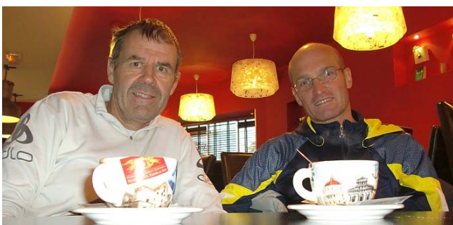
Der Cappuccino, der mithilft, die Nr. 170 zu beenden

Dies ist aber leider bei vielen Marathons der Fall: Das angestrebte Wachstum geht auf Kosten der Qualität. Brauchen wir das?