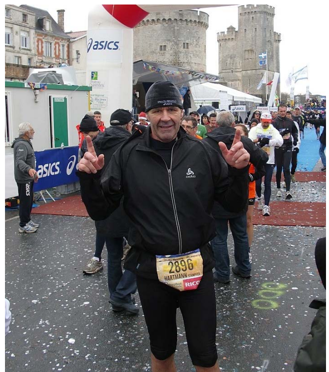
Jetzt beginnt der Heimreisemarathon: 18 Stunden!