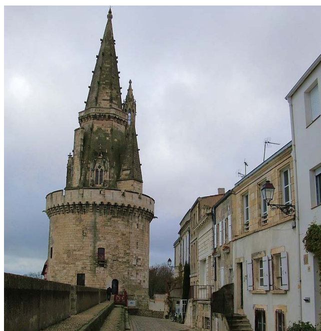
Tour de la Lanterne, neben dem Ziel an der Wehrmauer

Viel wurde für Werbung und Aufmachung investiert. Der Lauf verspricht viel, hält aber nicht alles. Die Medaille ist aber wunderschön!