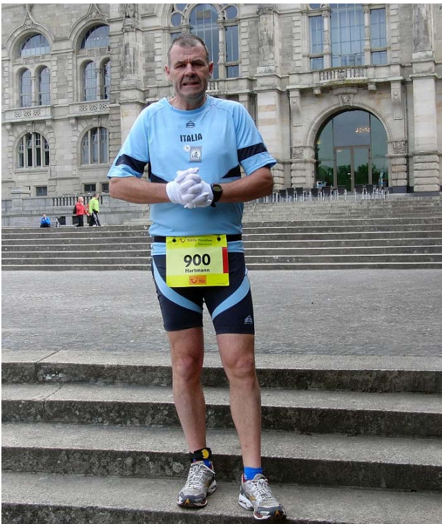
Wie wird die Eins nach 150? Ist wie eine neuer Beginn ...

Nun, den Marathon 1 nach 150 habe ich übrigens mit derselben Laufzeit wie meinen allerersten 42,2-km-Lauf vor 8 Jahren beendet, der Neuanfang ist also geglückt.