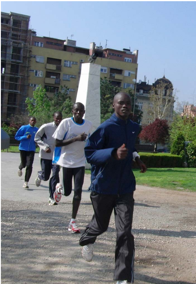
Die Topläufer beim Einlaufen am Samstag, mit der Wärme haben sie kein Problem, wohl eher zu kalt bei 20 Grad ;-)

Das schien hingegen die 10 Kenianer, die am Samstag gerade um die Nikolai-Kirche (Nikolajevska) im Alten Kern des Stadtteils Zemun ihre Einlaufunden drehten, nicht zu interessieren. Sie waren da und wollten wohl auch alle 10 ersten Plätze belegen und damit die reichlich fließenden Prämien einstreichen. Da blieben dann für uns „Normalos“ nur mehr ein Baumwoll-T-Shirt und eine Medaille übrig. Auch gut! Denn der Lauf war vorzüglich organisiert und die Meldung mit 30 Euro o.k.!