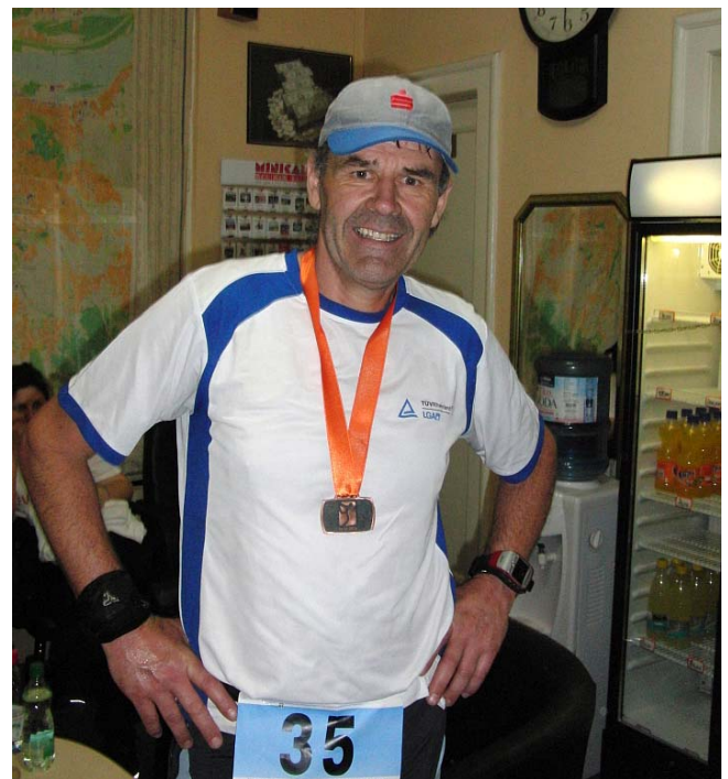
Was kommt nach 149? Das echte Jubiläum in Hamburg, meine Nr. 150

Die Hauptstadt Serbiens hat übrigens über 1.000.000 Einwohner und ist dessen politische, kulturelle und wirtschaftliche Metropole. Sie liegt an der Mündung der Save in die Donau.