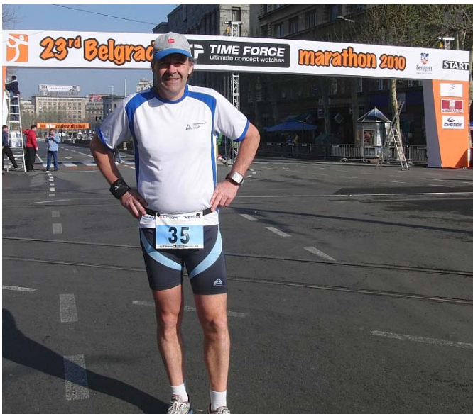
Wird warm heute bei meinem 149. Marathon in Belgrad, was wörtlich „Die weiße Stadt“ heißt.

Ach ja, Marathon gelaufen bin ich ja auch noch, musste ich ja, um dann in Hamburg am nächsten Sonntag meinen 150. Marathon laufen zu können.