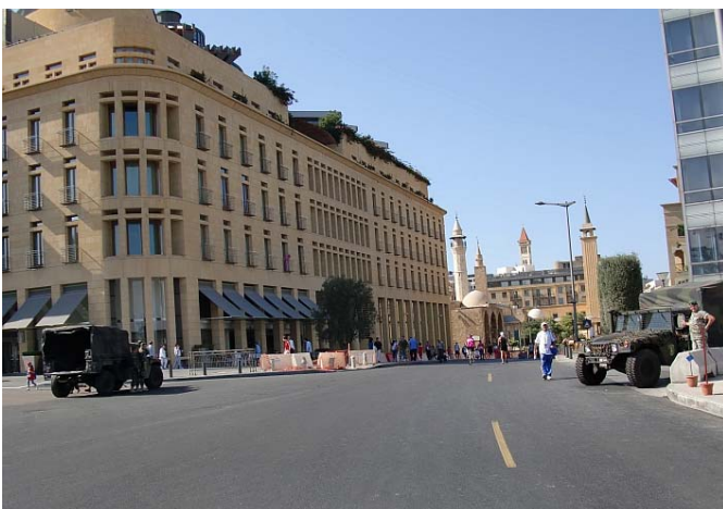
Bezeichnend für die ganze Strecke: hier bei km 41,8 links und rechts unsere Bewacher

Den Beirutmarathon muss man nicht unbedingt laufen, vor allem die sehr hohen Temperaturen machen das Laufen nicht gerade leichter.