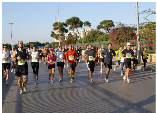
Es sind weniger Läufer als Bewacher unterwegs