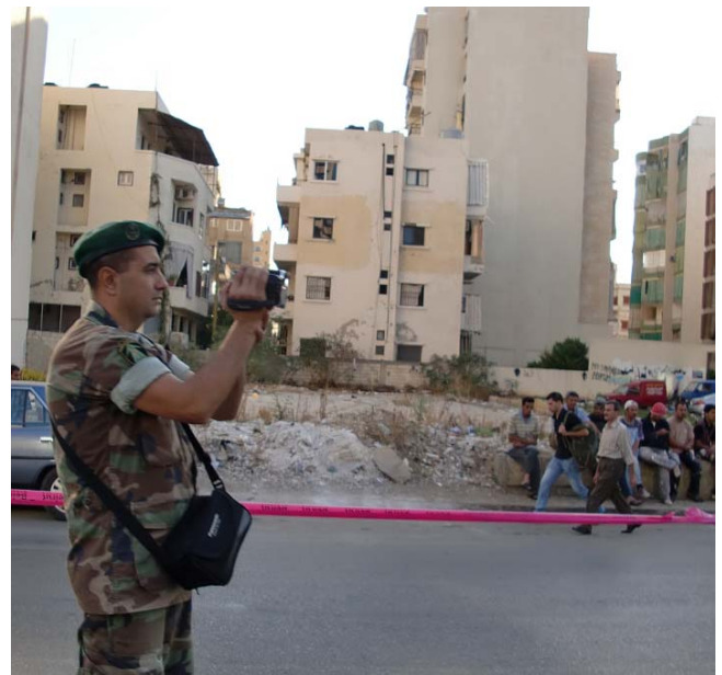
Ein Soldat, der ausnahmsweise mit einer Kamera bewaffnet ist, um uns beim Laufen zu filmen