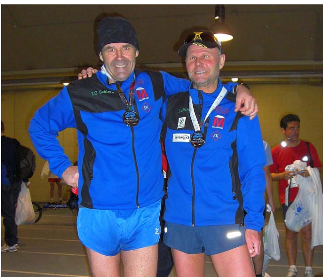
Die zwei von der Laufgemeinschaft Schlern

Zum Hineinbeißen schön, aber nicht empfehlenswert, sehr sauer das Ganze