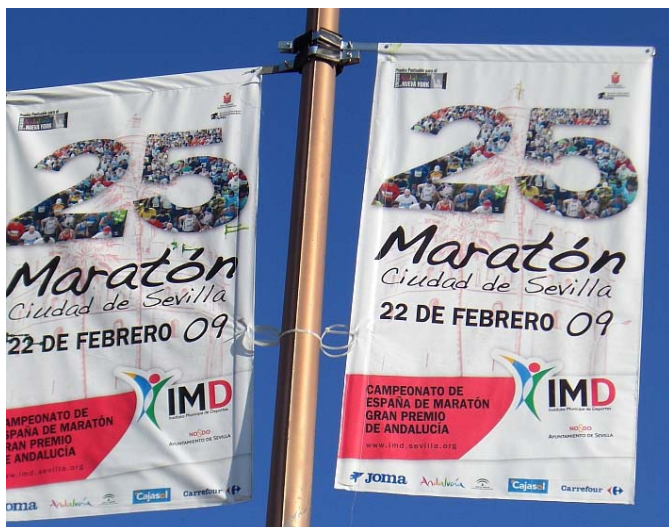
Stolzes Jubiläum hier in Südspanien