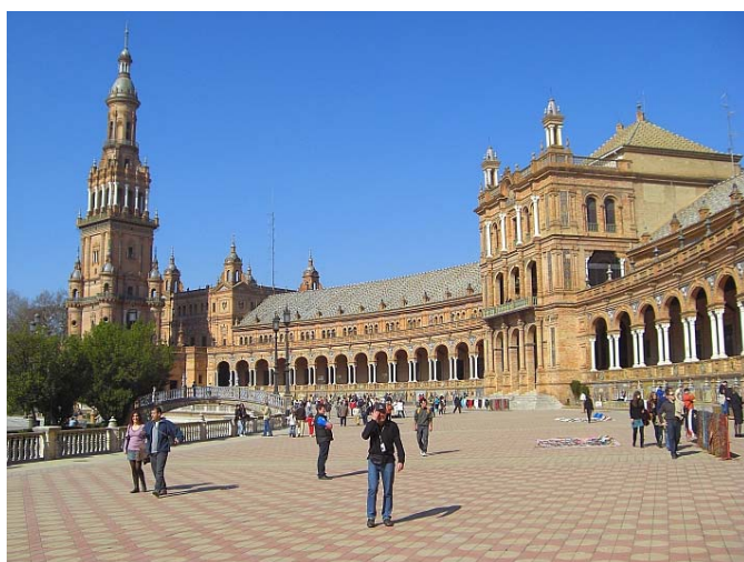
Plaza de España, sehr beeindruckend