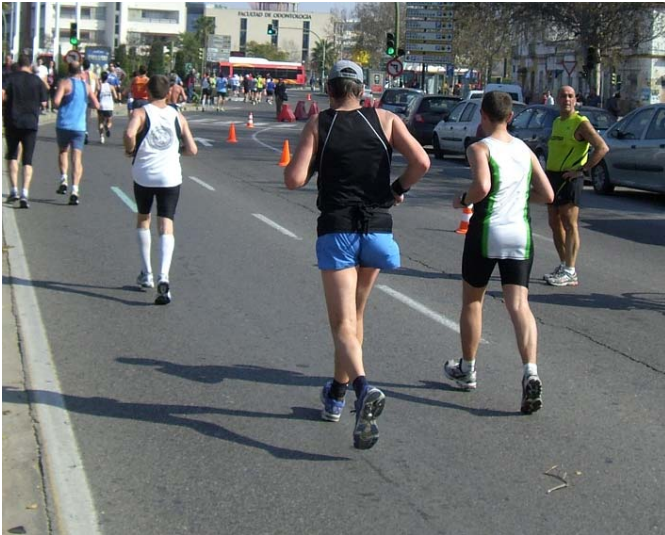
Mein Marathon Geheimtipp: Sevilla

Der Start erfolgt am Sonntagmorgen auf der anderen Seite des Flusses im Olympiastadion. Aber wo und wann waren in Sevilla Olympische Spiele? (Gar nicht, das Stadion wurde für die Bewerbung der Spiele von 2004 erbaut, den Zuschlag bekam aber Athen.)