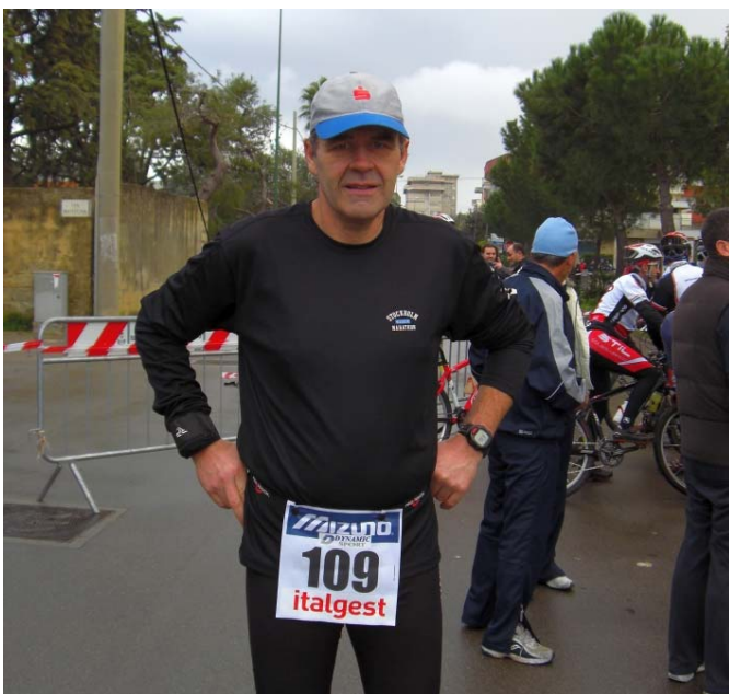
Wie wird das Wetter heute? Oder der Marathon?