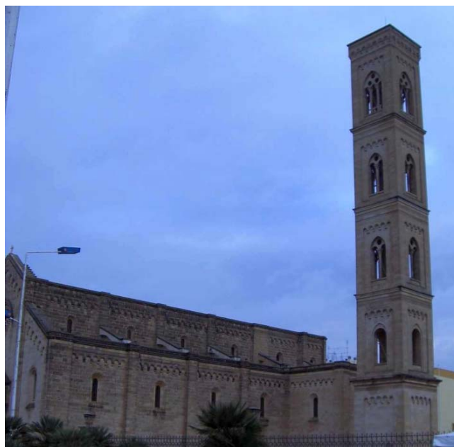
La Basilica di Santa Maria della Cultura di Parabita