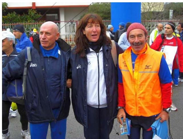
Die Ikonen im italienischen CSM-I 100