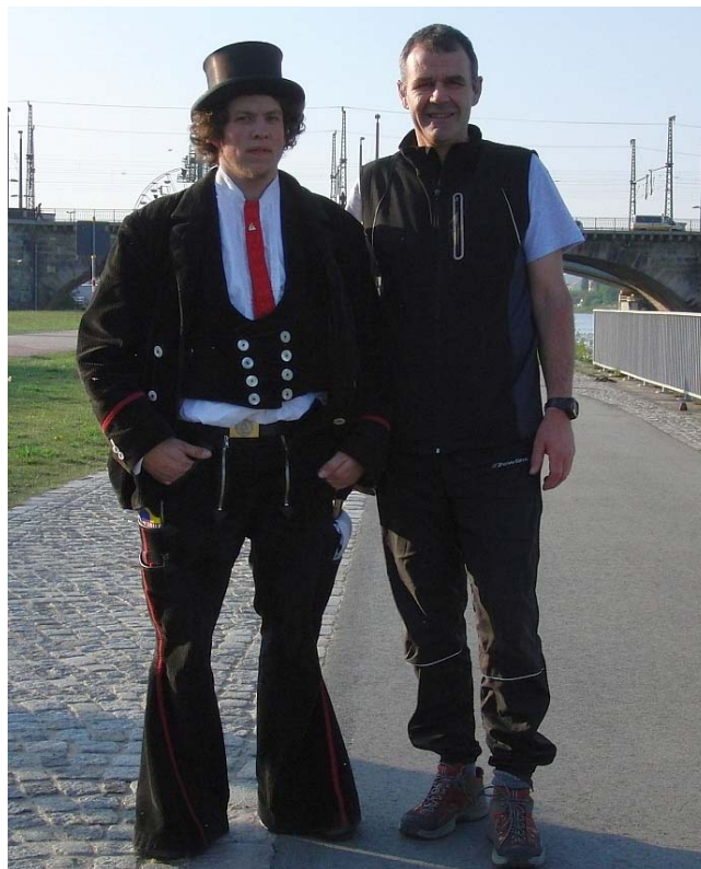
Auf der Walz