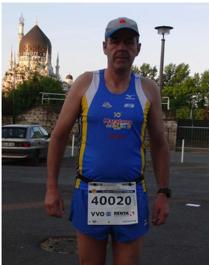
Wird heute ein langer Lauf: 42 km + 7 km = müde