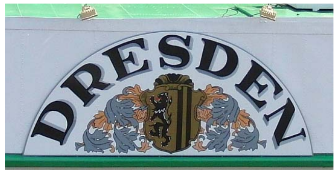
Schon zum 2. Mal, hier lohnt sich immer wieder