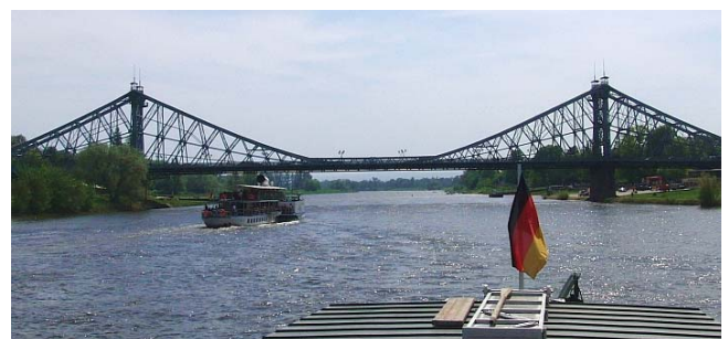
Das blaue Wunder