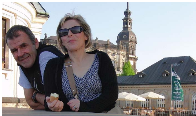
Schön hier an der Elbe

Beim ins Ziel gehen kommt mir übrigens ein Geselle auf der Walz in den Sinn, den ich am Vortag in Dresden getroffen habe.