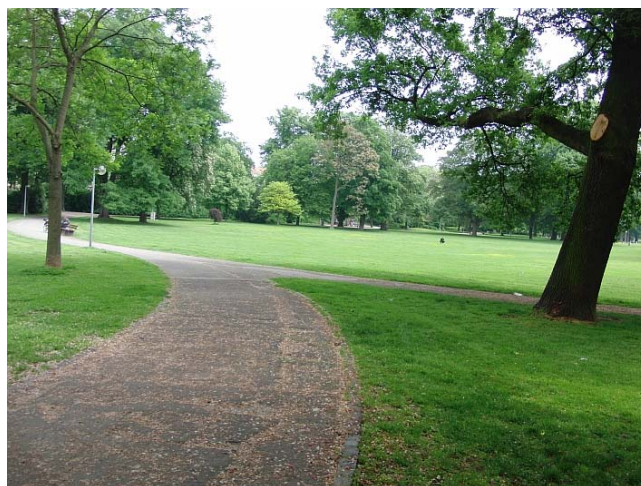
Man könnte sich hier gut einwärmen, es ist aber schon warm