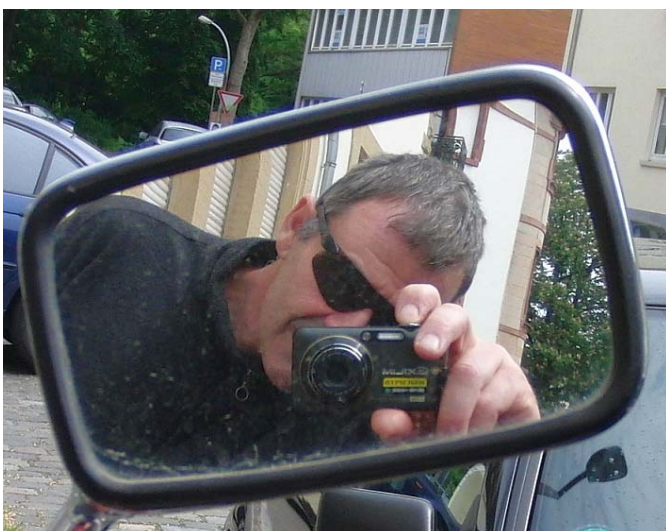
Immer diese Reporter, immer und überall