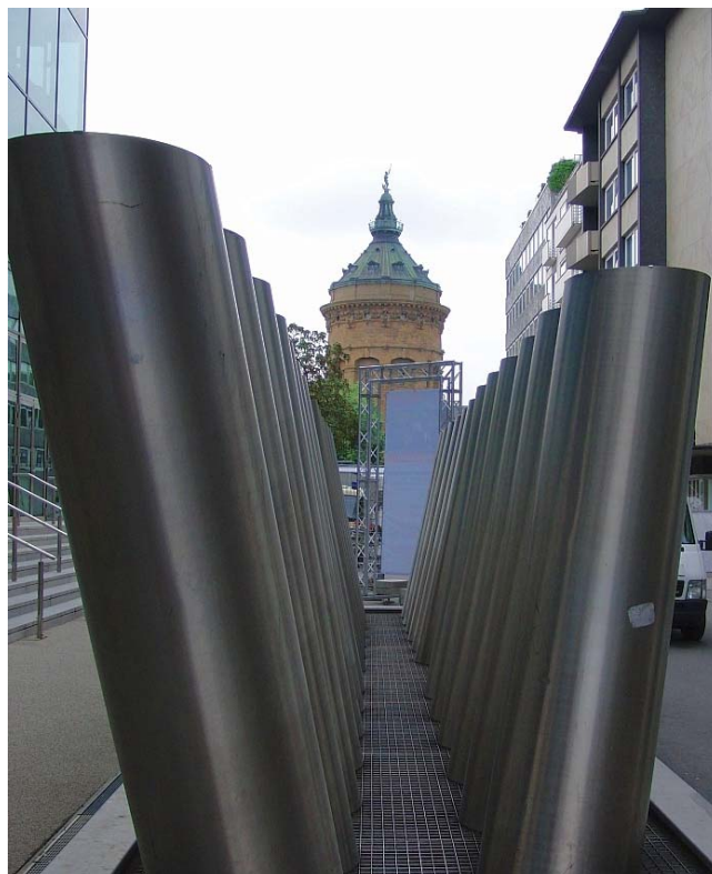
Modernes wechselt sich mit Historischem ab Wasserturm Friedrichsplatz

Klingt alles recht passabel und ist es auch