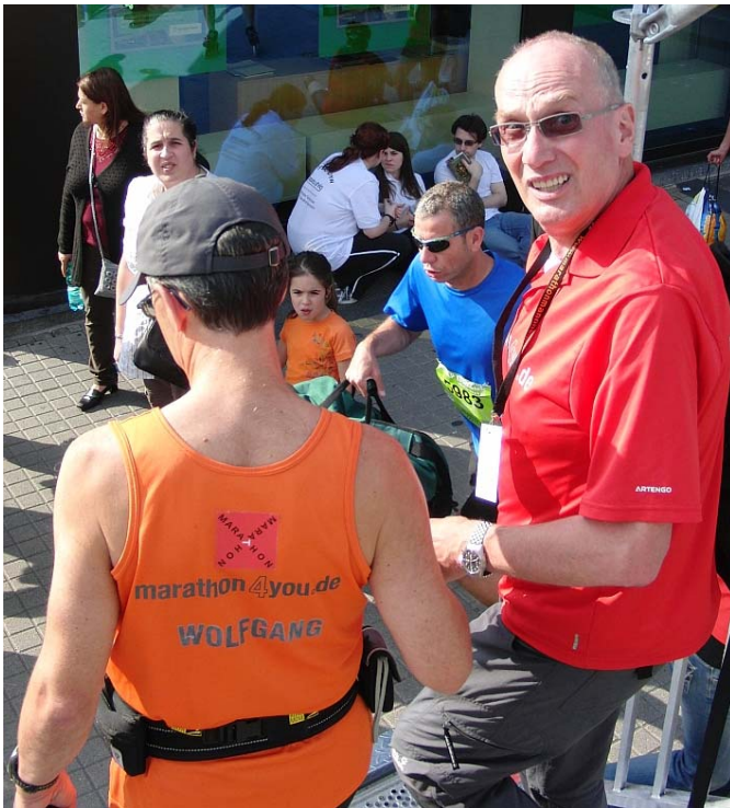
Der Marathonreporter und sein Chef

So komme ich nach 23 Uhr mit einer gehörigen Wut auf mich selbst im Bauch ins Ziel. Wütend deshalb, weil ich es in meiner Planung nicht bei einem Marathon, und zwar den in Mainz, belassen habe. Ich setze mich ins Auto und ab nach Hause, mit der Folge, dass ich an diesem Wochenende keinen Doppeldecker laufe. Ein Marathon pro Woche ist schließlich schon anstrengend genug!