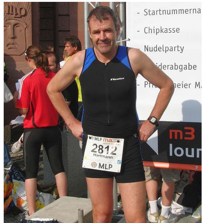
Hier sieht die Marathonwelt noch gut aus

So komme ich nach 23 Uhr mit einer gehörigen Wut auf mich selbst im Bauch ins Ziel. Wütend deshalb, weil ich es in meiner Planung nicht bei einem Marathon, und zwar den in Mainz, belassen habe. Ich setze mich ins Auto und ab nach Hause, mit der Folge, dass ich an diesem Wochenende keinen Doppeldecker laufe. Ein Marathon pro Woche ist schließlich schon anstrengend genug!