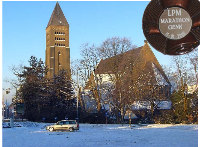
St. Martinskirche Sint-Martinuskerk in Genk