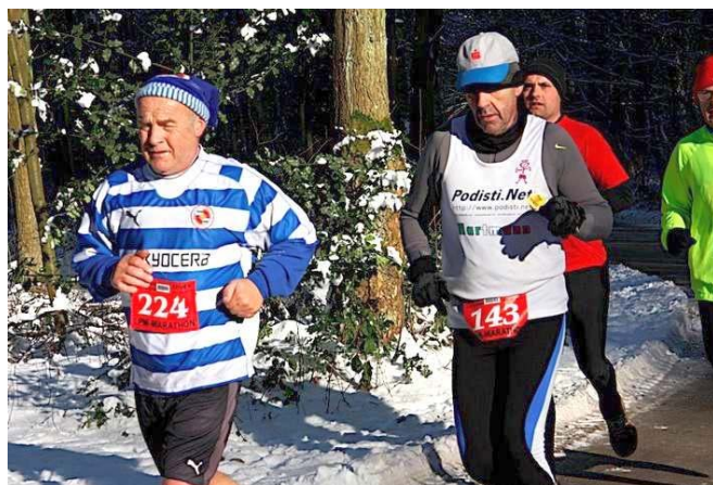
Da muss ich durch, jetzt hilft nichts mehr