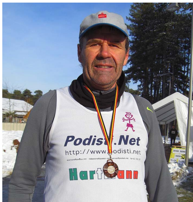
Nr. 111 habe ich geschafft, bei Eises Kälte