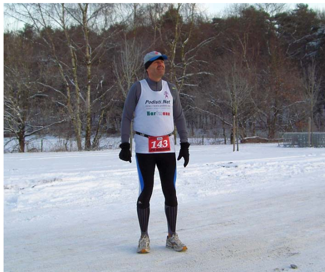
Wo ist bloß die Sonne?

Ich komme gut durch, durch diesen wahrlich kalten Wintermarathon, wohl auch dank meines mittlerweile guten Gefühls für Tempodosierung, wenn es von Nöten ist.