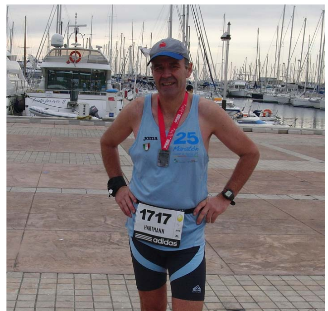
...und ich vor meinem 144.