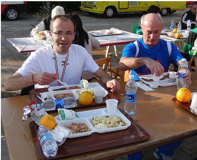
Die ewigen Esser in der Szene ;-))