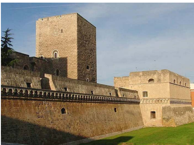
Castello Svevo di Bari (zu Deutsch wörtlich: Schwaben-Schloss) 11. und 12.Jhd.