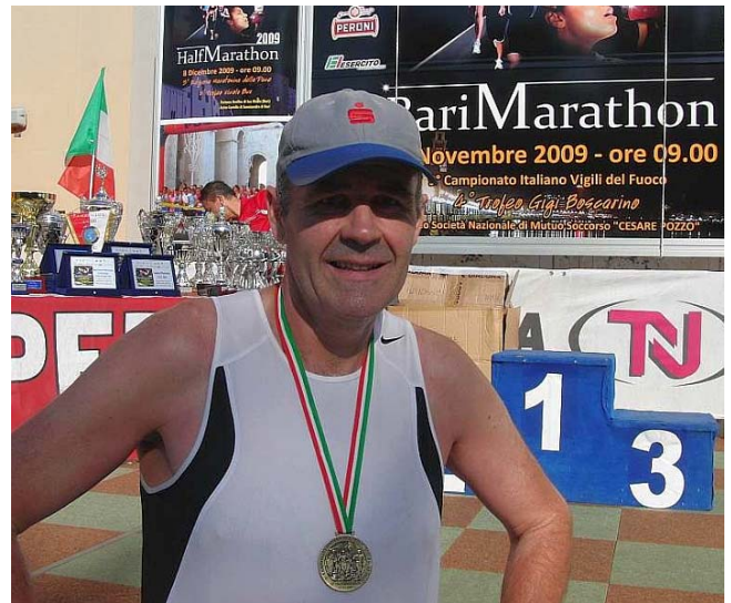
Warm heute, aber schön in Bari