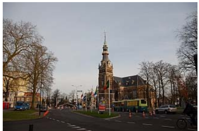
Apeldoorn, hier in der Nähe der Grote Kerk gibt es die Startnummern