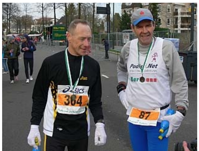
Sjørd und ich haben es geschafft, die Medaille und etwas zum Trinken gibt es als Lohn