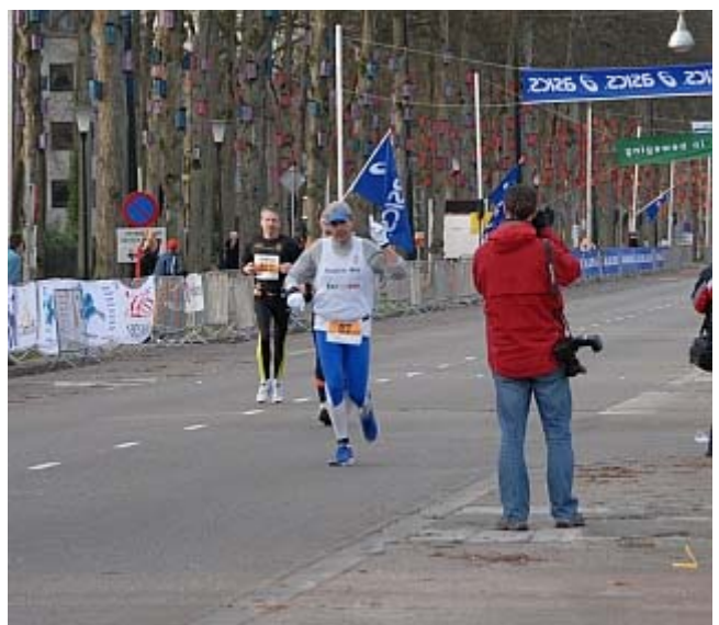
Beim Zieleinlauf: Heute habe ich es mir sehr gut eingeteilt, bei meiner Nr. 75