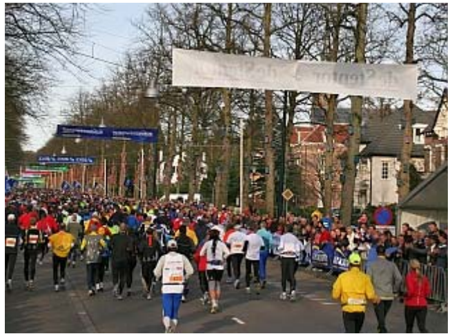
Diesmal laufe ich fast am Ende des Feldes los