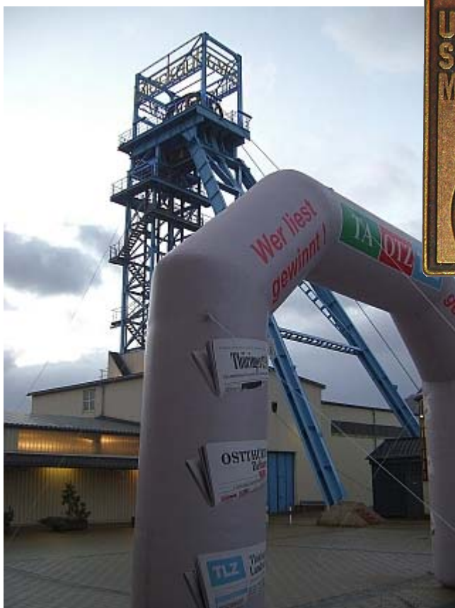
Eingang zum Schaubergwerk in Sondershausen