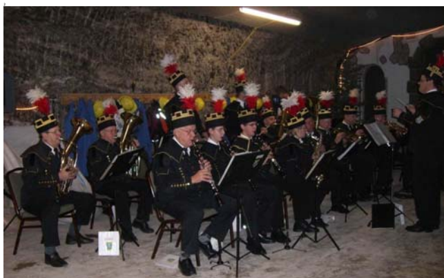
Die blasen uns jetzt den Marsch, ein Omen?

Zuerst muss ich allerdings Übertage die Startnummer und den Zeitmesschip abholen, den vorgeschriebenen Grubenhelm nehme ich jedoch nicht mit, weil mein besonders leichter Fahrradhelm aus längst vergangenen Rennradtagen eindeutig bequemer ist.