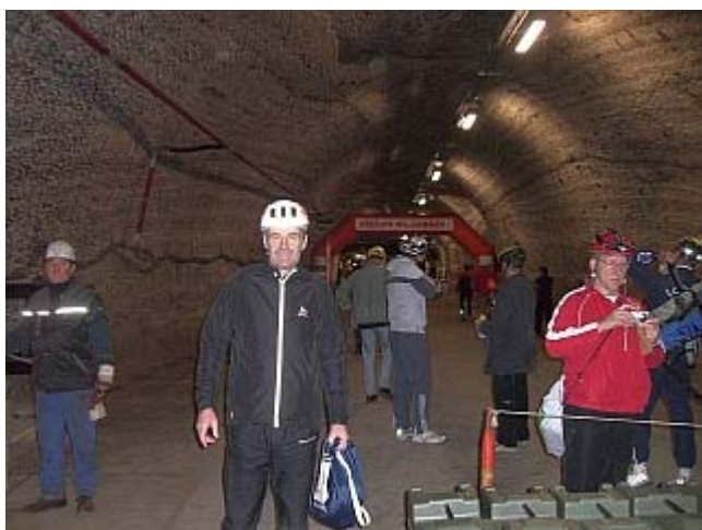
Das werde ich jetzt schnell ausziehen!

Ich war noch nie so tief „unter Tage“, so wird die Grubenfahrt ins Innere der Erde auch genannt. Ob ich Platzangst habe, weiß ich nicht, ein mulmiges Gefühl habe ich aber schon dabei, obwohl unter meinen Vorfahren auch ein Bergmann war. In meiner Heimat bin ich nur einmal mit einer Grubenbahn horizontal ein altes, aufgelassenes Kupferbergwerk gefahren, das jetzt als Bergbaumuseum dient, doch mit einem Förderaufzug bin ich nie 700 Meter tief in die Erde eingetaucht.