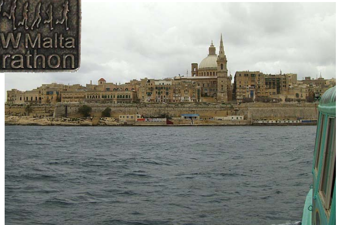
La Valletta, die Hauptstadt Maltas