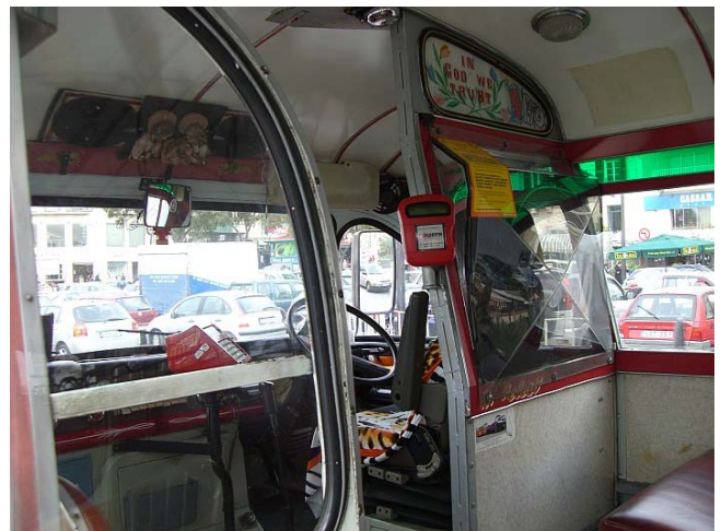
In den Uralt-Bussen geht es recht abenteuerlich zu