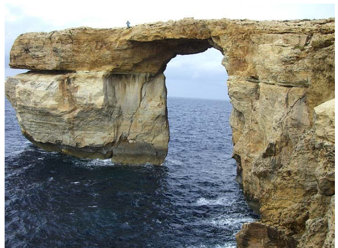
Die Insel Gozo und das blaue Fenster