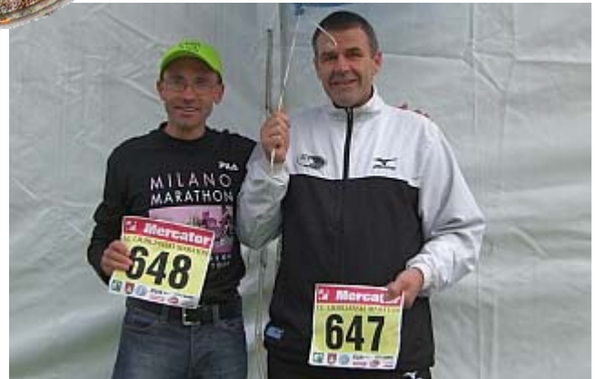
Die Startnummer haben wir schon mal