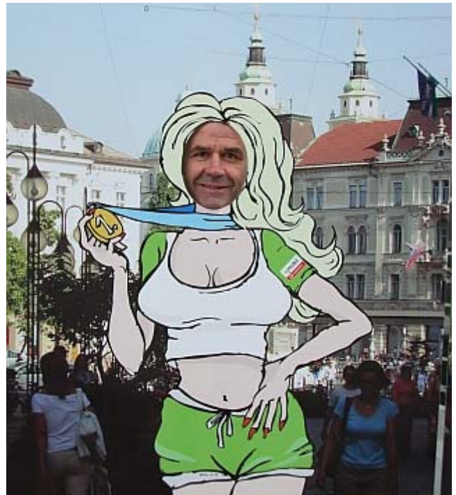
Es gibt wieder einmal eine Medaille in grün, ganz nach meinem Geschmack