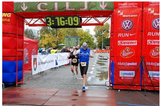
Die Zeit kann sich sehen lassen, - trotz oder vor allem wegen des Regens - will ich schnell ins Ziel

Die Kenianer laufen sich schon ein, es ist regnerisch, aber nicht kalt. Heute laufen wir wieder mal zwei Runden. Wenn ich an meine ersten Marathons zurückdenke und wie damals ein Zweirundenkurs kritisiert wurde! Heute würde ich sagen, es hat sogar Vorteile, wenn ich weiß, welche Strecke ich auf der zweiten Hälfte vorfinde. Hier in Ljubljana starte ich eher zu schnell, aber bremsen will ich nun auch wieder nicht. Der Kurs besitzt einen ersten Teil in der Stadt und einen zweiten draußen in Wald und Wiesen. Es lässt sich sehr gut und flüssig laufen, obwohl ein paar Wellen vorhanden sind.