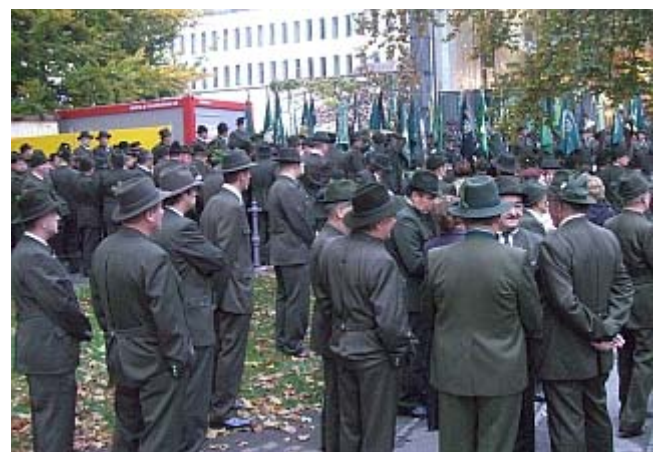
Die Herren in Grün wollten uns nicht aufnehmen. Ob sie meinen, wir sollen anderswo auf die Jagd gehen?