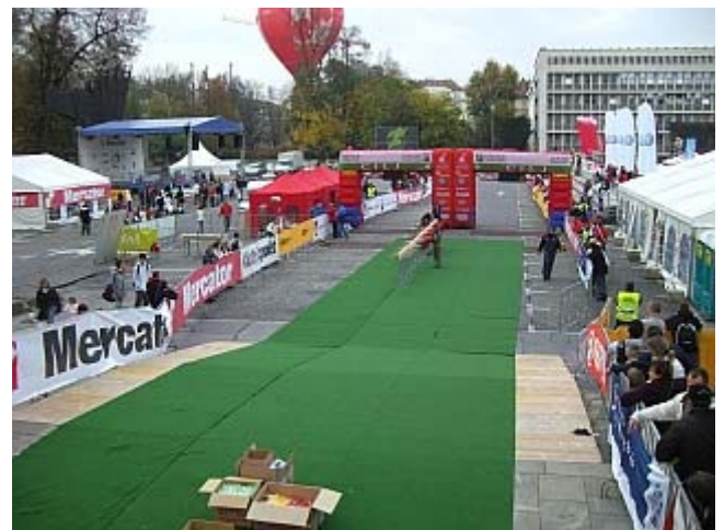
Hier werden wir morgen ins Ziel einlaufen