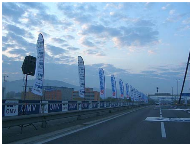
So einsam wird es morgen nicht, obwohl ich als letzter weit hinter dem Feld starte.