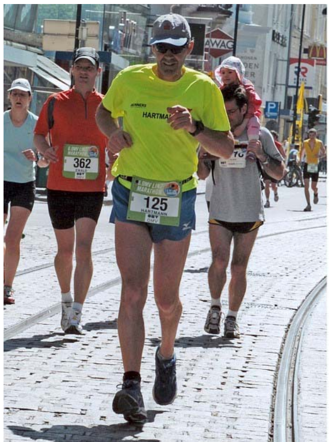
Die Nr. 125 ist auch happy gefinisht zu haben