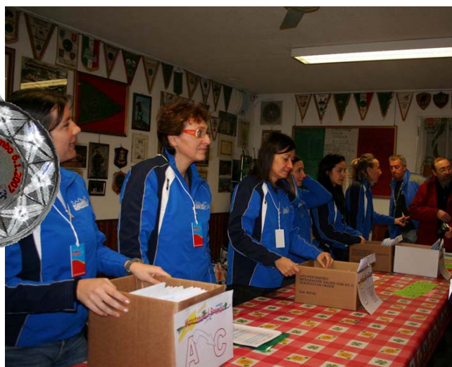
Die fleißigen Helferinnen und Helfer stehen schon bereit