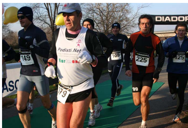
Am Morgen ist es noch kühl, aber wolkenlos