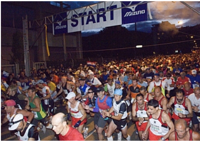
Start der 100-Km-Läufer um 22:00 Uhr