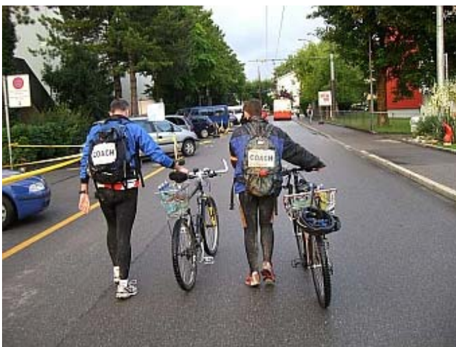
Nicht nur wir, auch die Begleiter auf dem Fahrrad sind müde