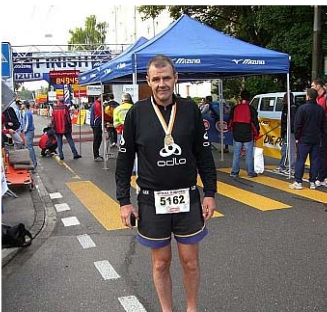
Nr. 52 ist gefinisht, doch das Gefühl im „Ziel“ ist eher deprimierend