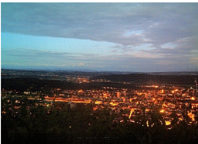
In Biel wird es langsam dunkel und die besonderen Läufer werden auf ihre lange Reise durch die Nacht geschickt