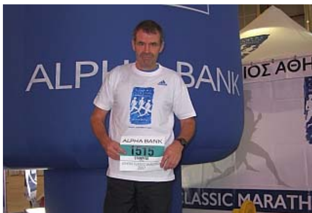
Auf der Marathonexpo gibt es die Startnummern