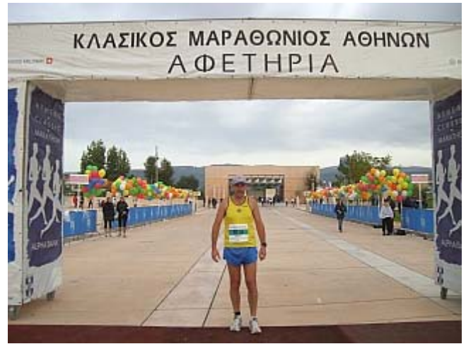
In Marathon heißt es vorerst, zwei Stunden herumstehen für einen Marathon, Sachen gibt es!!!

(Möglicherweise sogar über 400 km, nämlich von Athen nach Sparta, um Hilfe anzufordern, und von dort über Marathon nach Athen zurück!)