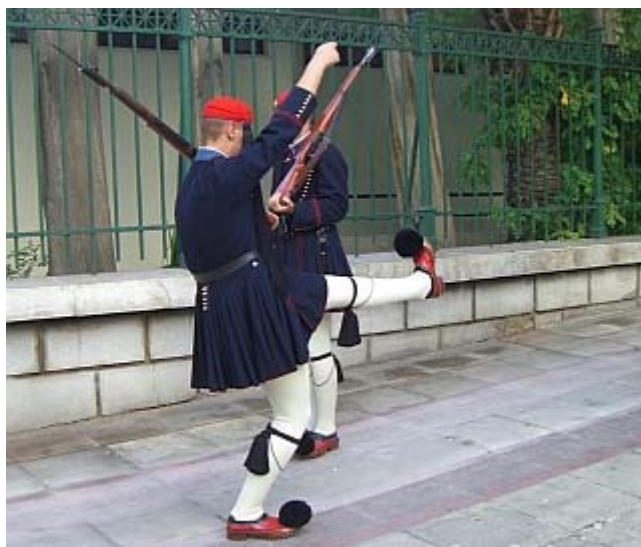
Seltsame Übungen machen diese Herren