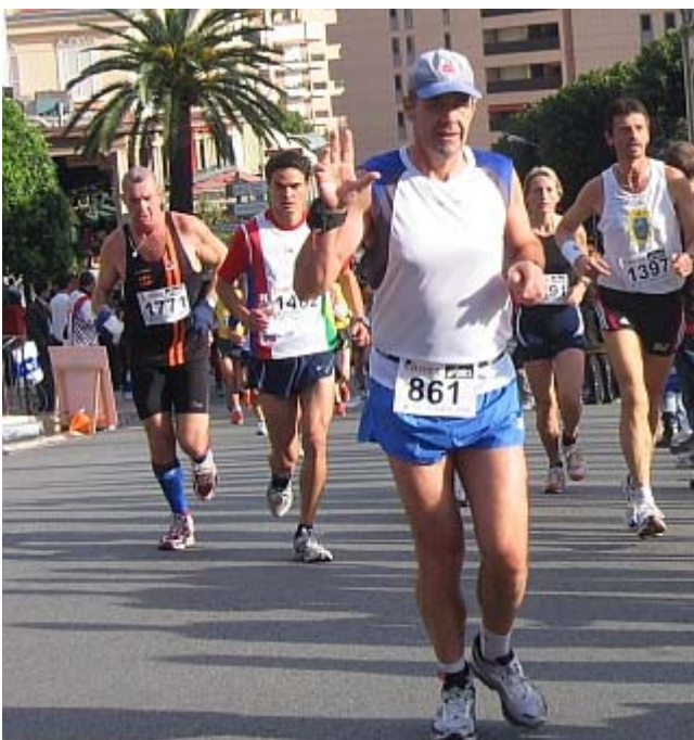
Und schon die steile Casinostraße hinauf, buuh!