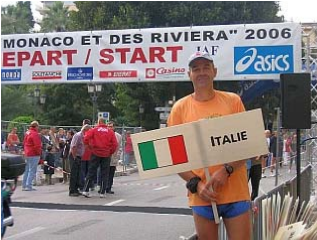
Start zum internationalen Marathon von Monaco