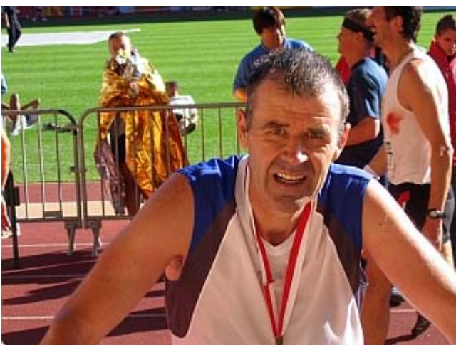
So wie ich im Stadion aussehe, so war es auch: eine ziemlich harte Sache

Zeit, solchen Verpflichtungen nachzukommen. Die internationale Läufer­schar bedankt sich dafür vor dem Start mit einem kräftigen Applaus.