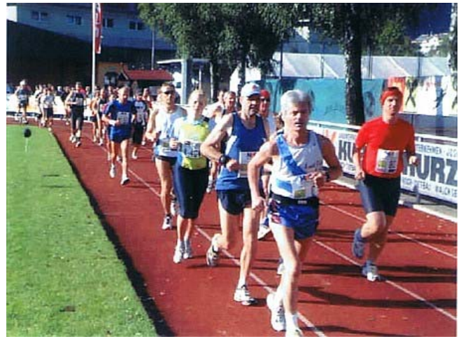
Raus aus dem Stadion und dann hinein in die Marathoneinsamkeit. Mit einigen Ausnahmen lief jeder alleine!

Fazit: Natürlich ist nach drei Hauptstadtläufen Wörgl kein Highlight, dies ist mir schon klar. Neue PB bin ich zwar gelaufen und belege damit den dritten Platz in meiner Altersklasse, aber so recht freuen kann ich mich darüber nicht.