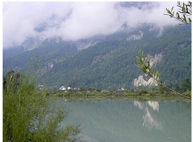
Am Inn entlang, Idylle pur!