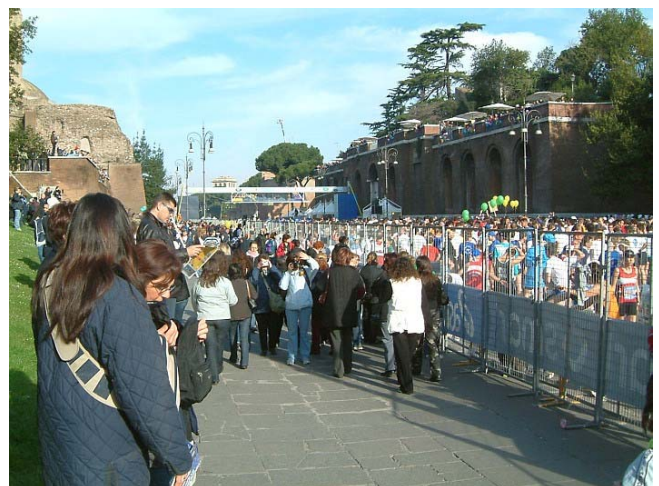
Endlich geht es los, Richtung Piazza Venezia