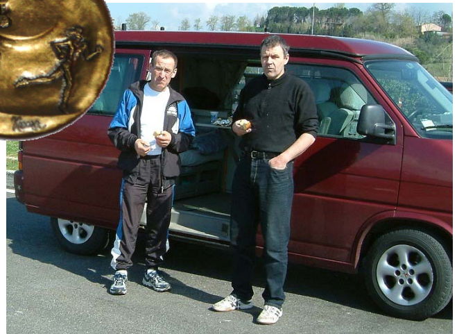
Auf dem Weg nach Rom, beim Verpflegen