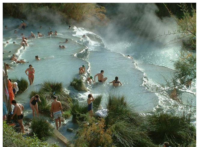
Nach dem Marathon ist bekanntlich vor dem Marathon! Deshalb pflege ich noch meine müden Beine in Saturnia im 35 Grad warmen Schwefelwasser.