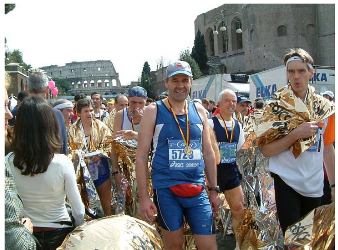
Ich habe es geschafft und habe mit zwei identischen Hälften, genussvoll die Sehenswürdigkeiten in mich einsaugend, gefiniht